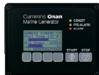
Cummins Onan Digital Display